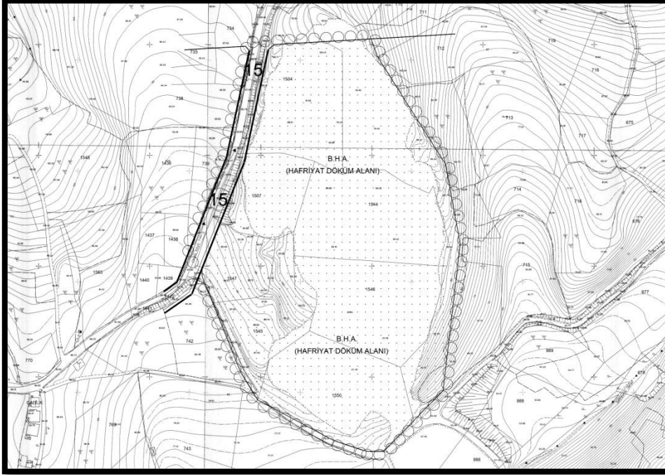
1/1000 ölçekli mevcut plan durumu