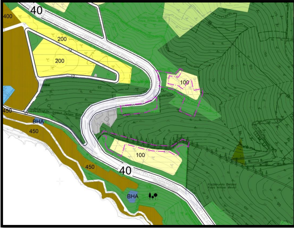
1/5000 ölçekli mevcut plan durumu

Plan değişikliği yapılan alanlar onaylı 1/5000 ölçekli Gemlik Nazım İmar Planında brüt 100 kişi/ ha. yoğunlukta Meskun Konut Alanı ile Park Alanında kalmaktadır.