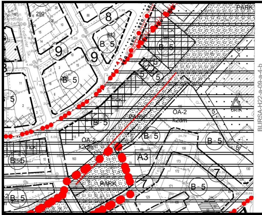
1/1000 ölçekli öneri plan durumu

Plan değişikliği neticesinde Park Alanına 172m 2 alan ilave edilmiştir.