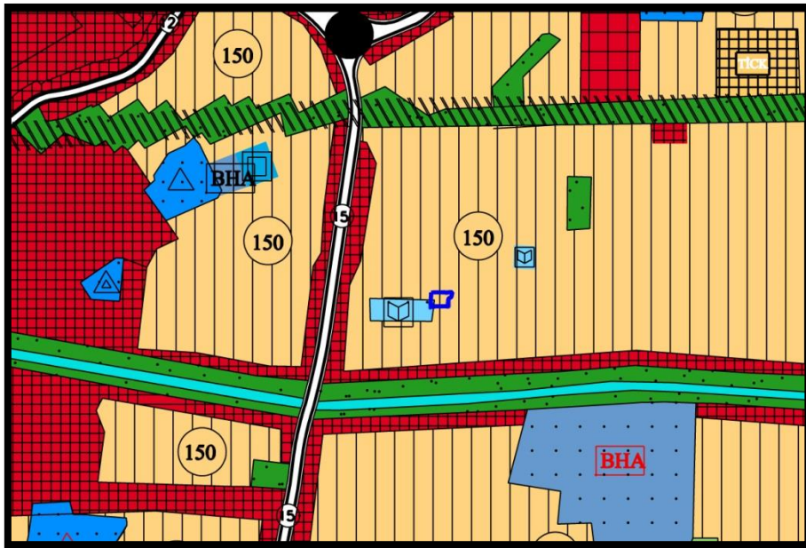
1/5000 ölçekli mevcut plan durumu

1/5000 ölçekli Gemlik Nazım İmar Planında brüt 150 kişi/ha. Meskun Konut Alanında kalmaktadır.