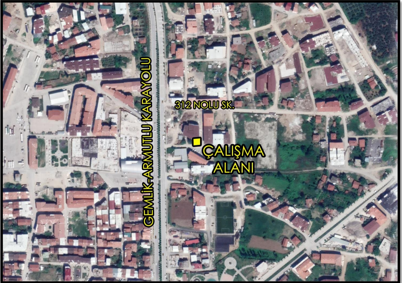
1/1000 ölçekli uygulama imar planı değişikliği yapılan alanın konumu