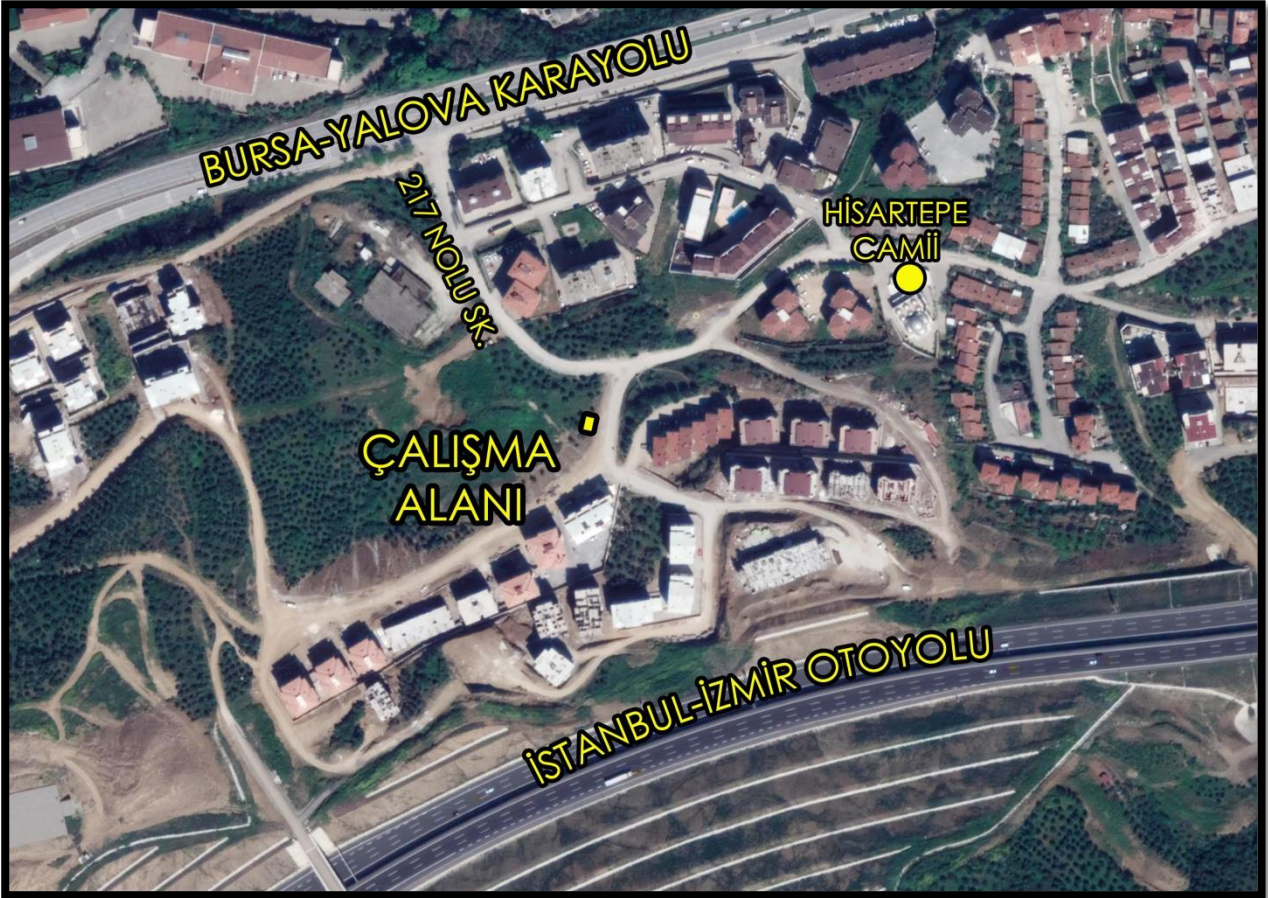
1/1000 ölçekli uygulama imar planı değişikliği yapılan alanın konumu