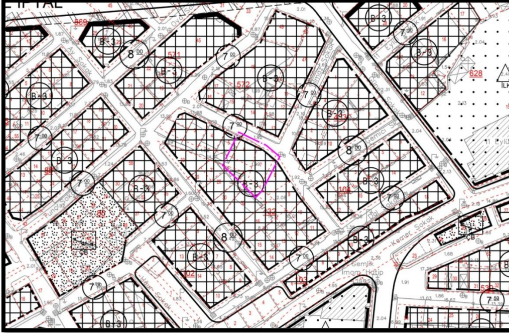
1/1000 ölçekli mevcut plan durumu

1/5000 ölçekli Gemlik Nazım İmar Planında Tali İş Merkezleri Alanında kalmaktadır.