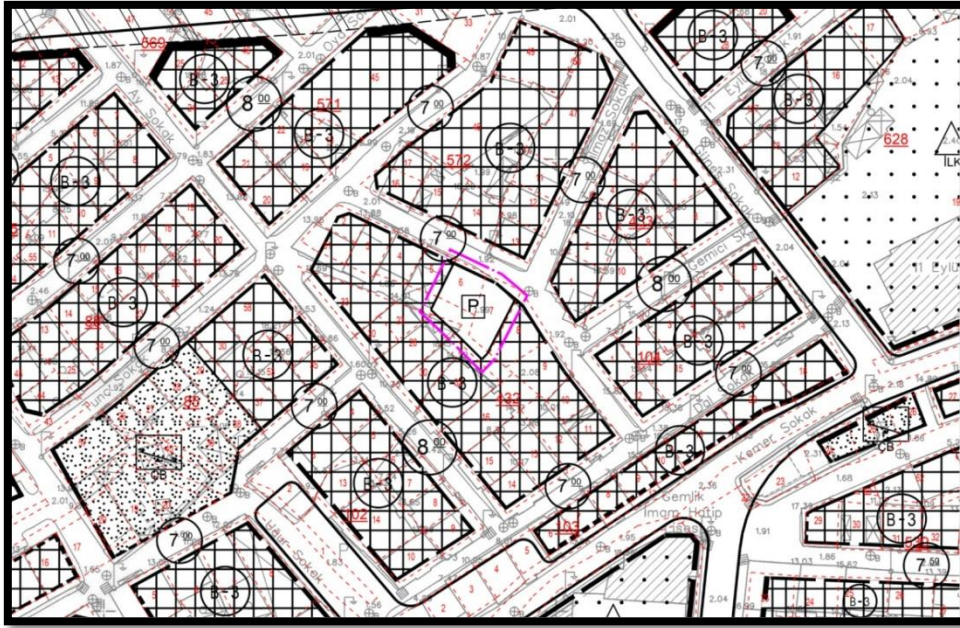
1/1000 ölçekli öneri plan durumu

Hazırlanan 1/1000 ölçekli uygulama imar planı değişikliği ile 432 ada, 6 ve 7 nolu parseller ile söz konusu parsellerin arka cephesindeki kadastral yol ve 26 nolu parselin bir kısmı otopark alanı olarak planlanmıştır. Planlanan otopark alanı 220m 2 'dir.