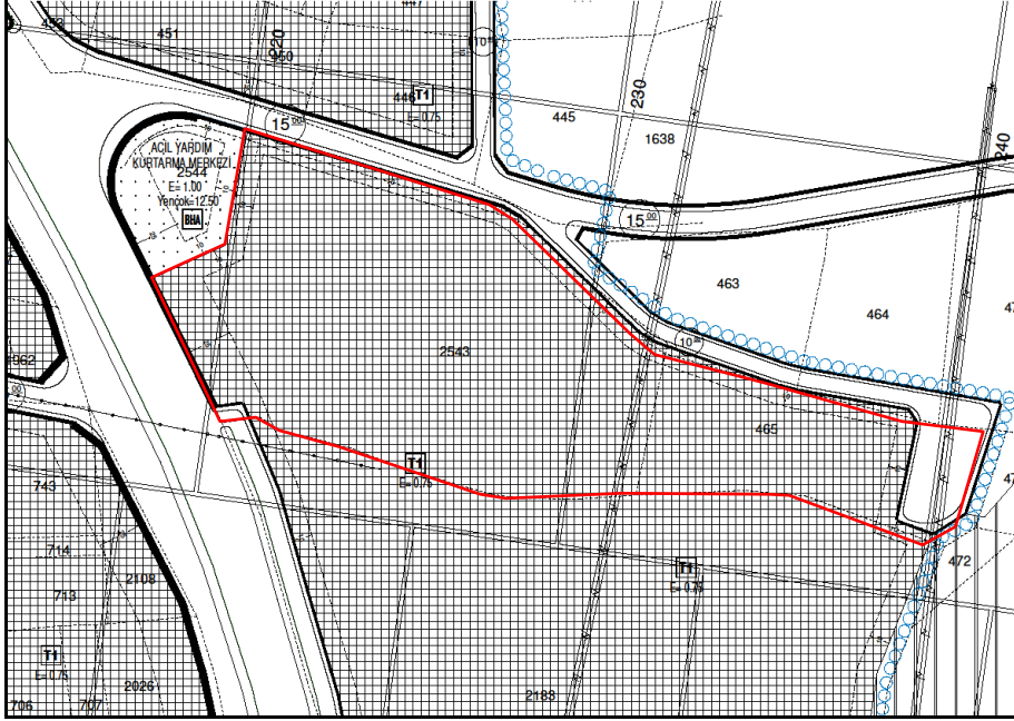
Şekil 2- Gemlik Belediye Meclisinin 17.04.2015 Gün Ve 106 Sayılı Kararı Ve Büyükşehir Belediyesi Meclisinin 24.12.2015 Gün Ve 2402 Sayılı Kararı İle Onaylı 13 Pafta 465 Parsel Ve Çevresi

Gemlik Belediye Meclisinin 17.04.2015 gün ve 106 sayılı kararı ve Büyükşehir Belediyesi Meclisinin 24.12.2015 gün ve 2402 sayılı kararı ile onaylı planda 2543 parselin tamamı ticaret alanında, 465 Parselin bir kısmı yol ve yol dönüş alanında, bir kısmı da ticaret alanında kalmakta olup, parselde çekme mesafeleri 10 metre olarak belirlenmiştir.