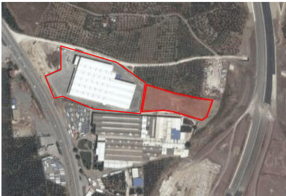
Şekil 4- Gemlik İlçesi, Engürücük Mahallesi 13 Pafta 465 Parsel Uydu Görüntüsü

Bursa-Yalova yoluna 370m mesafede olan 13 Pafta 2453 parsel 25,055.00 m 2 imar uygulaması yapılmış parsel, 465 Parsel 9860.00 m 2 tarla vasfındadır.