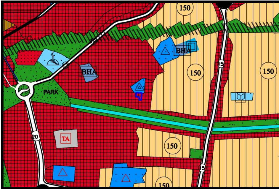
1/5000 ölçekli mevcut plan durumu

1/5000 ölçekli Gemlik Nazım İmar Planında Tali İş Merkezleri Alanında kalmaktadır.