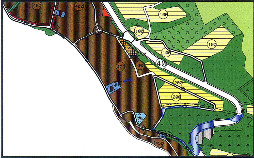
1/5000 ölçekli mevcut plan durumu

1/5000 ölçekli Gemlik Nazım İmar Planında brüt 400 kişi/ha yoğunlukta meskun konut alanında kalmaktadır.