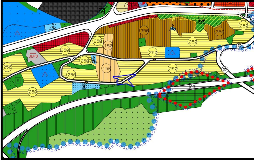
1/5000 ölçekli mevcut plan durumu

1/5000 ölçekli Gemlik Nazım İmar Planında brüt 250 kişi/ha yoğunlukta gelişme konut alanında kalmaktadır.