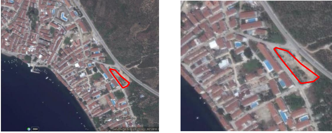
Şekil 3- H22A03D1C Pafta 441 Ada 6 Parsel Plan Değişikliği Alanının Küçükkuşla Yerleşimi İçindeki Konumu

H22A03D1C ve Pafta 441 ada 6 parsel doğusu boş alan ve güneyinde mevcut 5 katlı konut kullanımında binalar bulunmaktadır, parsel alanı kumla çevre yolu ile kumla giriş yolu üzerinde bulunmaktadır.