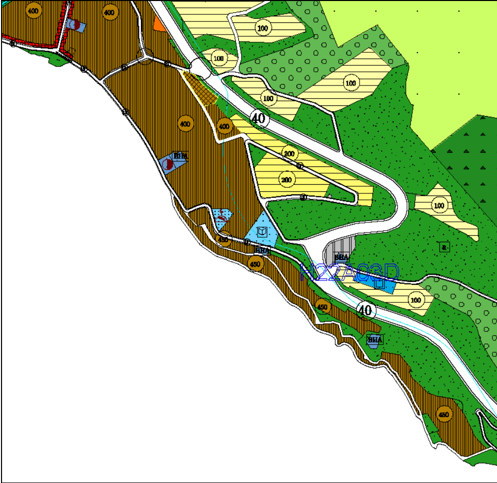
Şekil 1- Büyükşehir Belediyesince Onaylı H22A03D Pafta 441 Ada 6 Parsel Küçükkumla Nazım İmar Planı Değişikliği

Plan değişikliği alanı Bursa Büyükşehir Belediye Meclisinin 28.12.2016 gün ve 2856 sayılı kararı ile onaylı Küçükkumla 1/5.000 ölçekli Nazım İmar Planı değişikliğinde konut+ticaret alanında kalmaktadır.